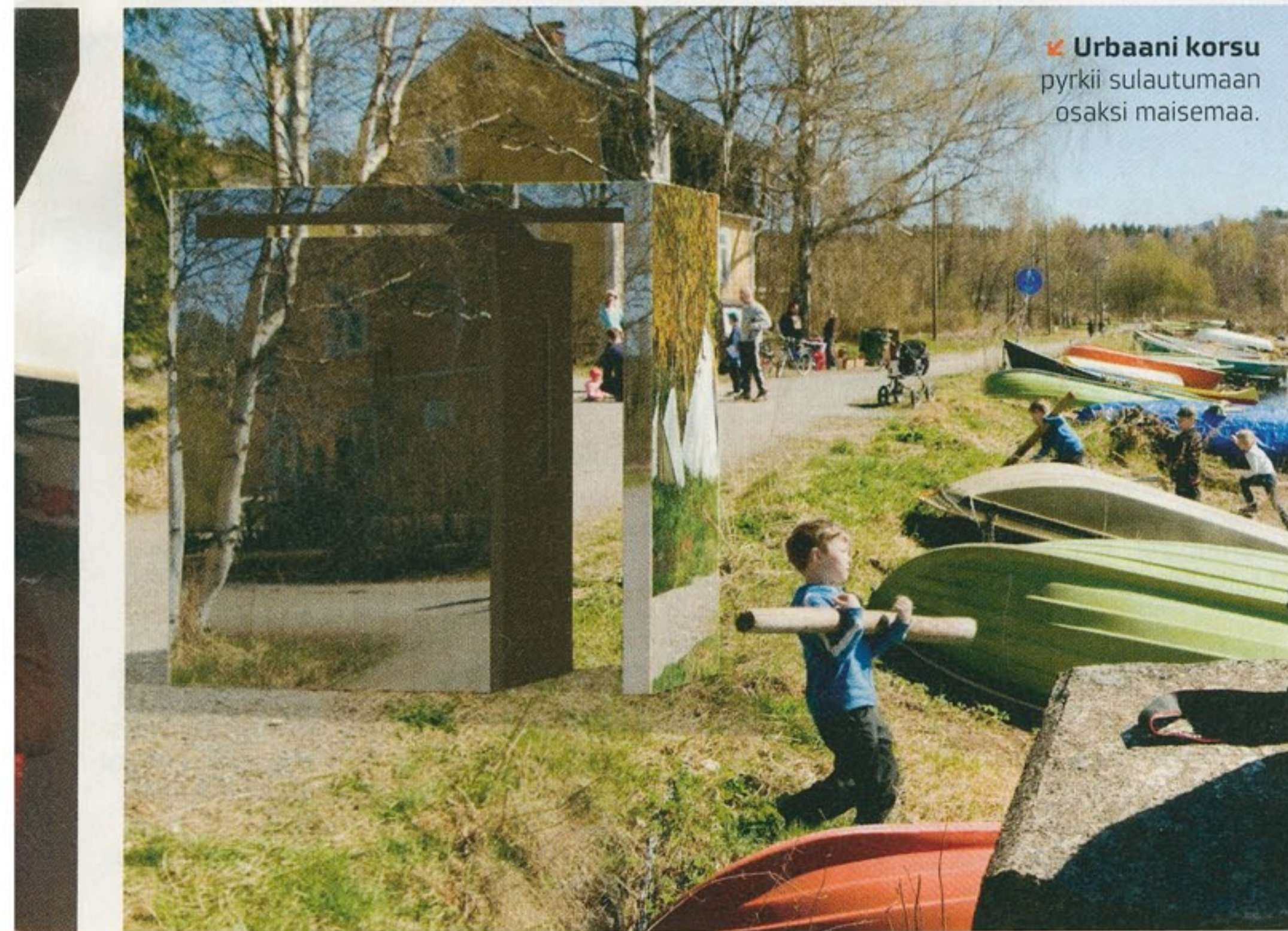
➤ Urbaani korsu pyrki sulautumaan osaksi maisemaa.